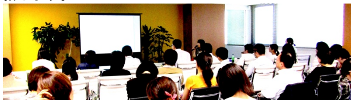
2017 年度のパイロット事業の様子

当事業では、①医療機関の外国人患者受入れ体制整備の推進や受入れ時の患者対応に必要な知識やスキルを包括的に学べる「外国人患者受入れ医療コーディネーター研修」、②外国人患者の受入れに関するさまざまなテーマから、自分の関心にあったテーマを選んでオンラインで手軽に受講できる「外国人医療テーマ別オンラインセミナー」の 2 つの教育プログラムを開催します。JIGH では、この 2 つの教育プログラムの開催を通じて、医療機関における外国人患者受入れ体制整備の推進や職員の外国人患者対応力の向上に貢献することを目指します。